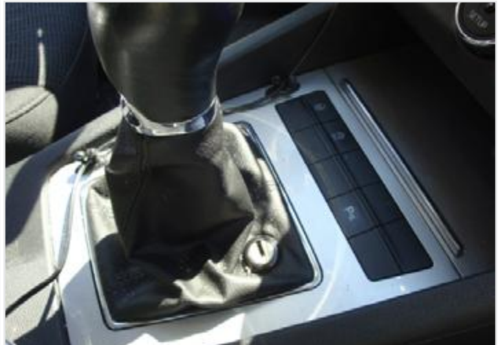
FOTO 9 – Fotografie panelu ovladačů spouštění oken a ovladače elektrických zrcátek